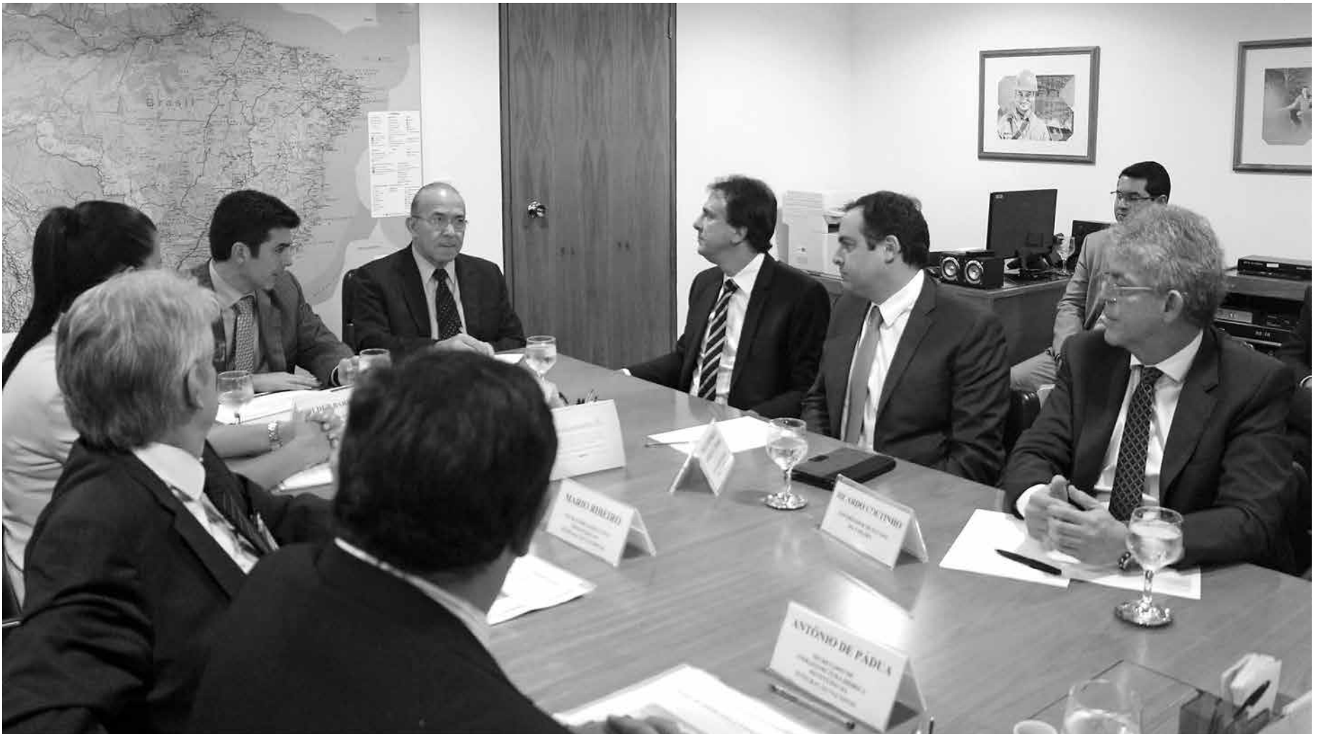
O governador Ricardo Coutinho recebeu do ministro Helder Barbalho a garantia de que as águas da transposição do Rio São Francisco deverão chegar a Monteiro em março

Após a audiência, Ricardo comentou que o ministro Barbalho afirmou que as águas do Rio São Francisco chegarão ao município de Monteiro em março. "As águas devem chegar em Monteiro no início do mês de março e, provavelmente, depois de uns 30 dias chegarão em Boqueirão, que abastece Campina Grande. Porém, é preciso estruturar a sustentabilidade da operação do sistema, não só do ponto de vista financeiro, mas essa é a grande preocupação do Governo Federal e nossa também. O sistema tem que ser autossustentável, ele é caro, afinal é a maior obra de transposição hídrica da história do Brasil e precisa ter recursos suficientes. É preciso mandar a matéria para a Assembleia Legislativa, que será