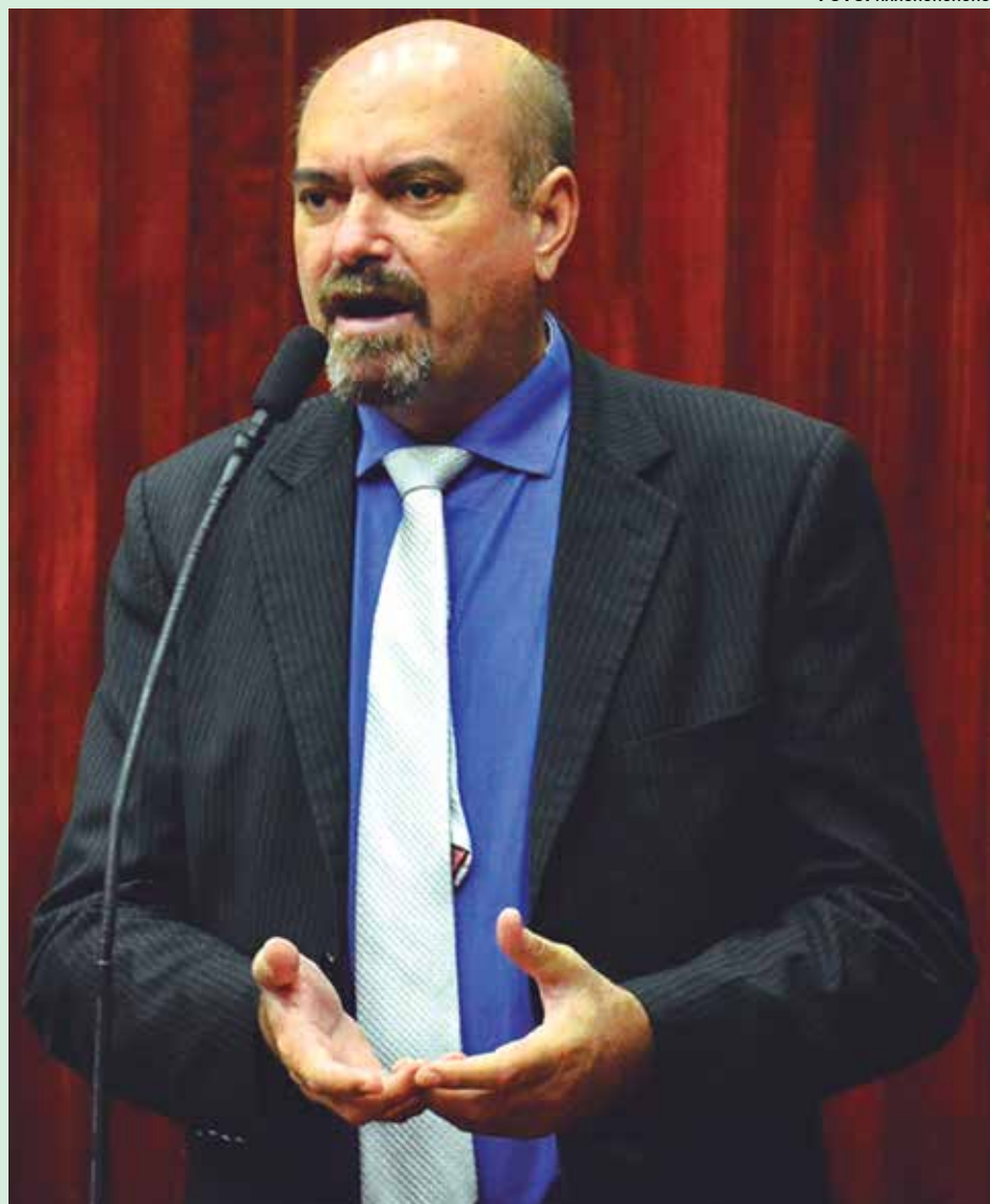
Deputado estadual paraibano considera que o Governo Federal trata obra com descaso