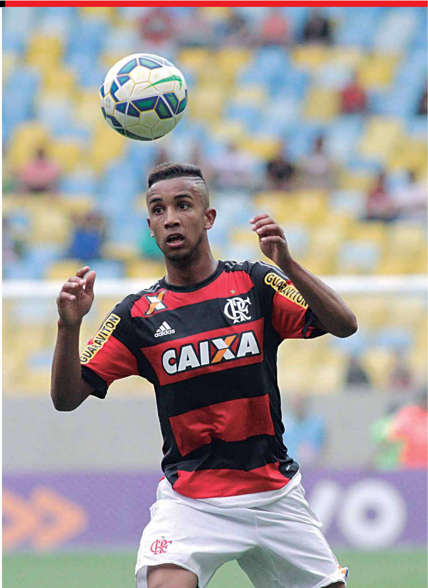
Jorge atuou na quarta-feira pela Seleção Brasileira no amistoso contra a Colômbia e no dia seguinte o Flamengo confirmou a venda

Godinho foi, até 2013, sócio e braço-direito de Eike Batista, um dos principais alvos desta nova fase, chamada de Operação Eficiência.