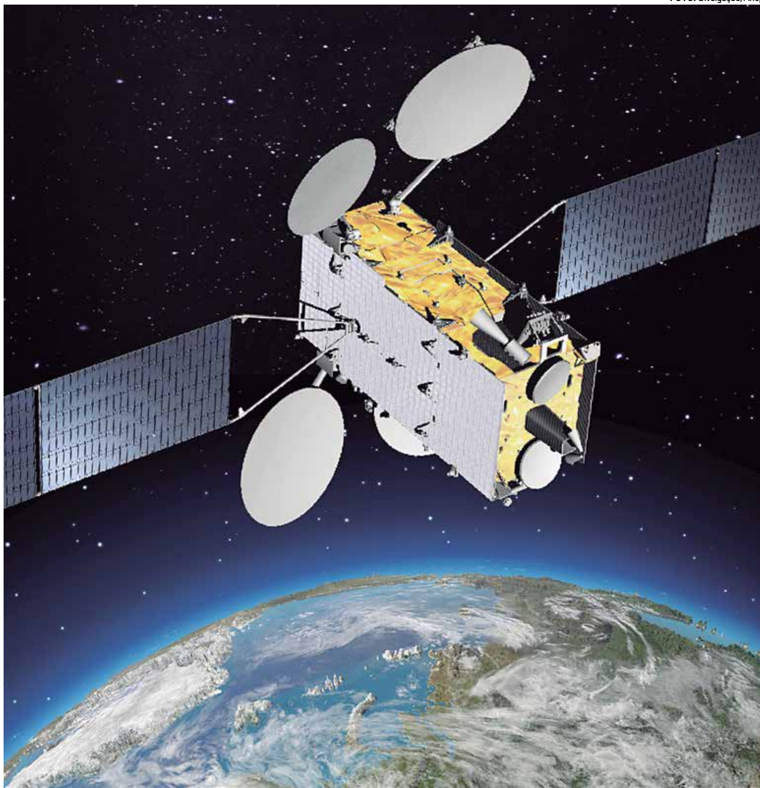
Satélite tem como objetivo reforçar a segurança e a independência na comunicação e ampliar o acesso à internet banda larga