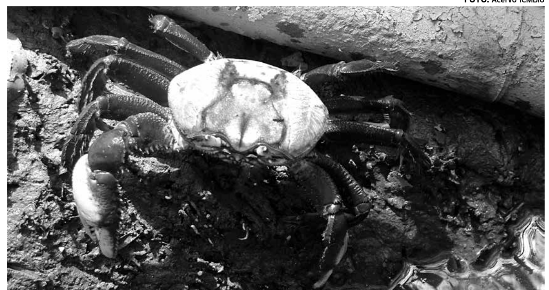
Os períodos de defeso são definidos para coincidir com a fase de acasalamento desses animais

A "andada" é o comportamento característico da espécie, que ocorre em seu período reprodutivo, quando machos e fêmeas saem de suas galerias (tocas) e andam pelo manguezal, para acasalamento e liberação de ovos. Nos últimos anos tem se verificado uma crescente diminuição nos estoques desse recurso natural, isso devido à poluição e destruição do seu ambiente natural, os manguezais e a captura de indivíduos indiscriminadamente, sem cumprir-se as regras de proteção à fauna, que proíbe a captura de fêmeas do caranguejo-uçá em qualquer época do ano e de-