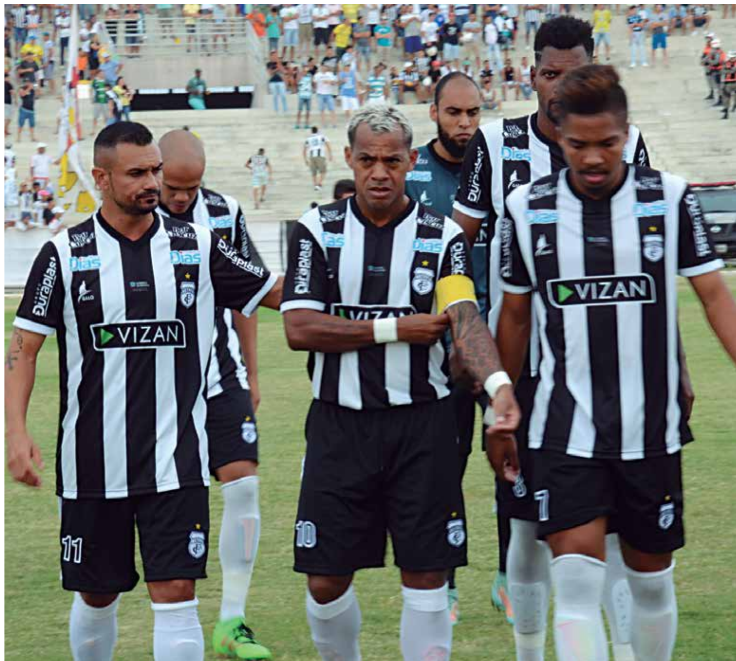
Jogadores do Treze durante clássico contra o Campinense no último domingo quando do empate de 1 a 1. Adversário agora será o Paraíba