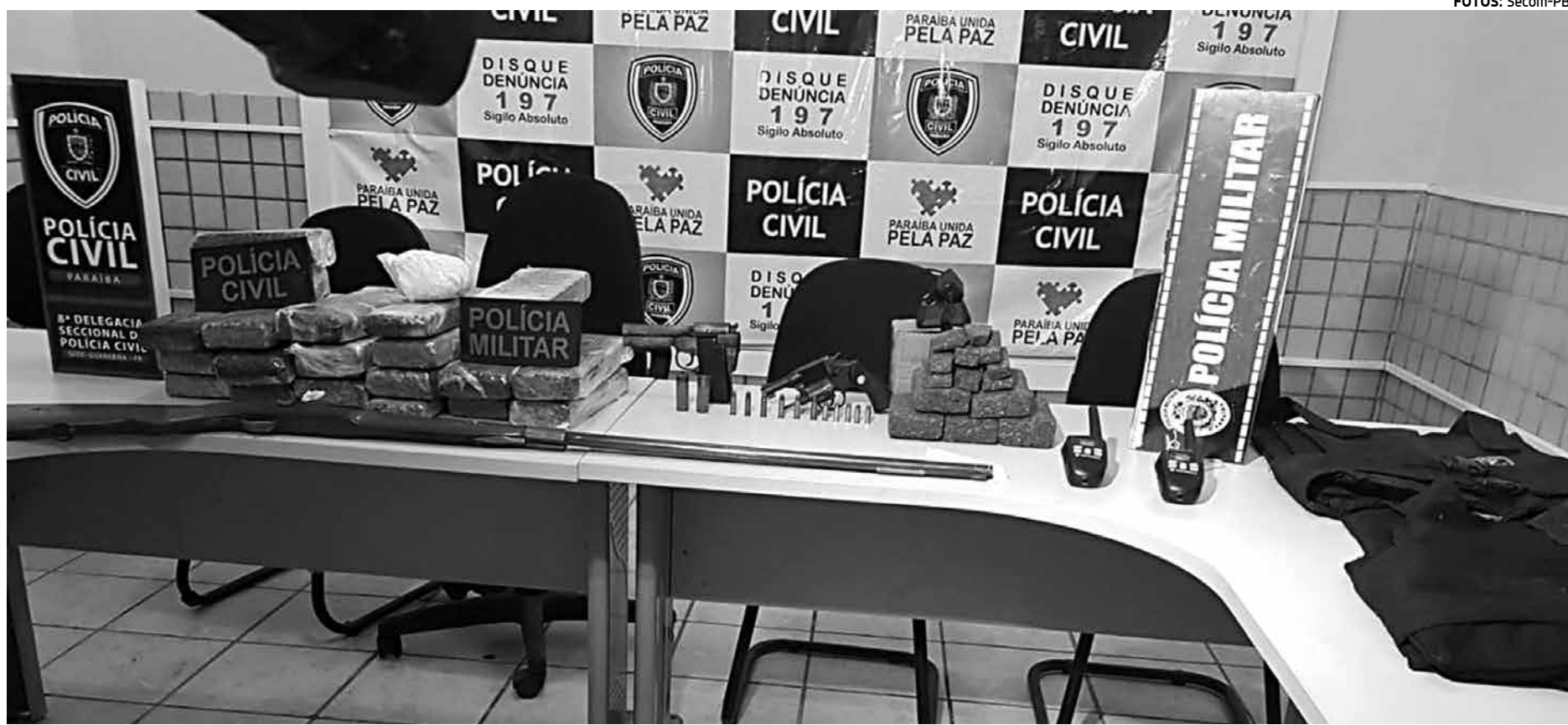
160 homens e mulheres das Polícias Civil e Militar e do Corpo de Bombeiros, além de 50 viaturas, atuaram nas ações da Operação "Rede do Mal", que prendeu 17 pessoas

Ele ainda acrescentou que o nome da operação foi escolhido por fazer referência à atividade criminosa desenvolvida pelo grupo. "Essas pessoas formavam uma rede de relacionamentos para a