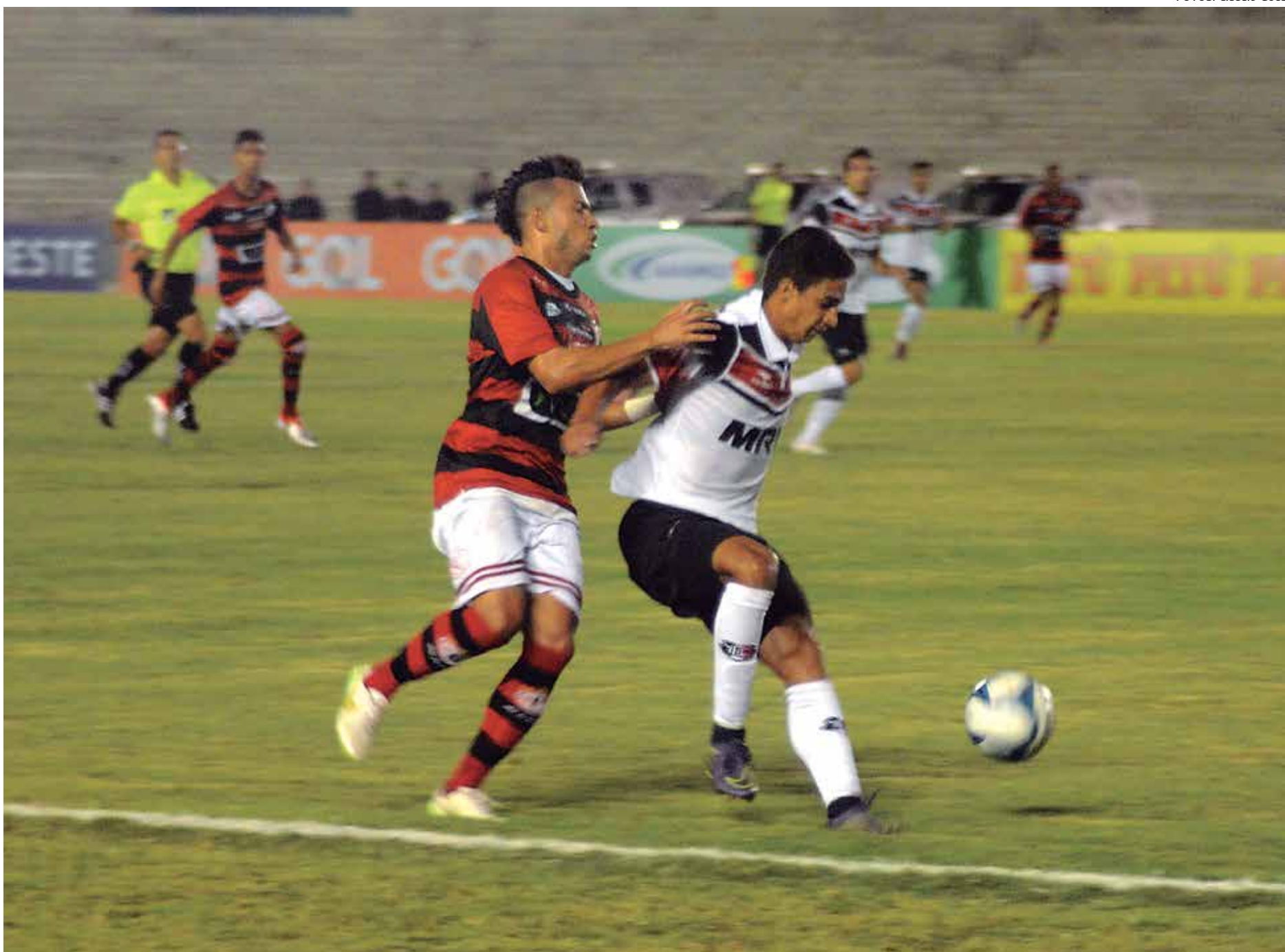
O Campinense criou várias chances de gol durante a partida no Amigão, chegou a marcar, mas foi surpreendido no final com um gol de pênalti marcado pelo adversário

Com os resultados da primeira rodada, o Náutico lidera o grupo A, com 3 pontos. Em seguida, vem Cam-