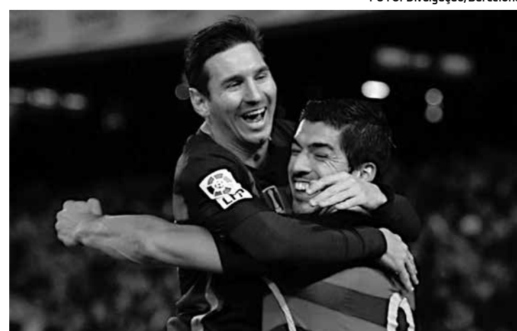
Messi e Suárez já marcaram 30 gols na atual temporada pelo Barça

Cavani e o brasileiro Lucas Moura fizeram 26 gols na atual temporada do Campeonato francês, seis do ex-jogador do