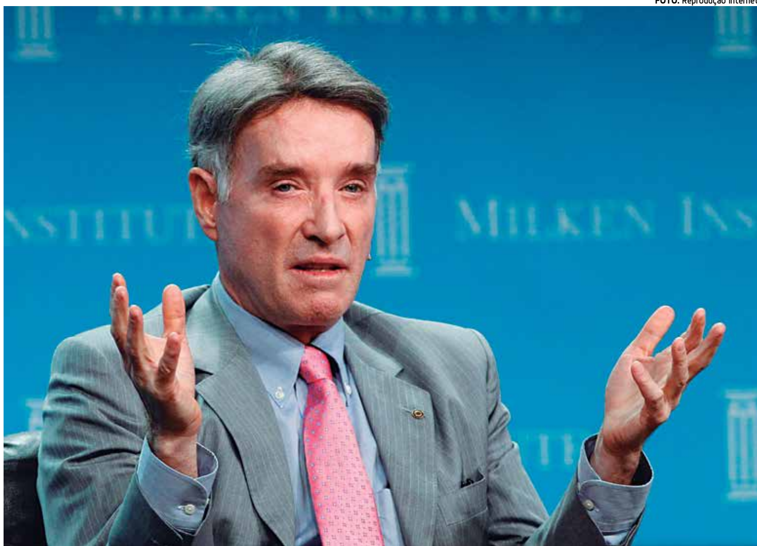
O empresário Eike Batista é acusado de envolvimento em esquema de corrupção e lavagem de dinheiro juntamente com Sérgio Cabral

A defesa do empresário informou que ele ficou 'surpreso' com a ordem de prisão. O advogado disse que Eike vai se apresentar, mas não disse quando isso vai ocorrer.