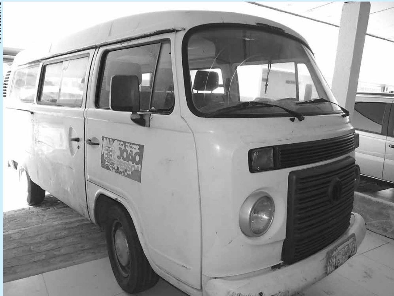
Veículo que foi localizado no bairro de Água Fria com drogas pertence ao Viveiro de Plantas Nativas da Semam