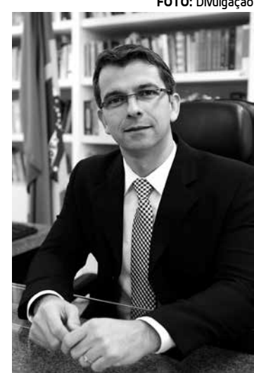
Juiz atuou no biênio 2015-16

No último biênio, a Turma Recursal solucionou 25.986 processos, sendo 11.493 ações no ano de 2015 e 14.363 em 2016 - resultando em 24,97% a mais neste último ano se comparado com o anterior. Os litígios solucionados tiveram, em sua maioria, temas relativos aos direitos dos servidores públicos e à Previdência Social (aposentadoria por invalidez, auxílio-doença, benefícios da assistência social).